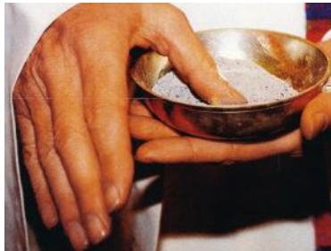
Le 21 février, la première semaine des vacances, n'oubliez pas de recevoir les Cendres.

Mais aussi, cette année, temps pour entrer en Carême, pour reprendre la route à la suite de Jésus-Christ.