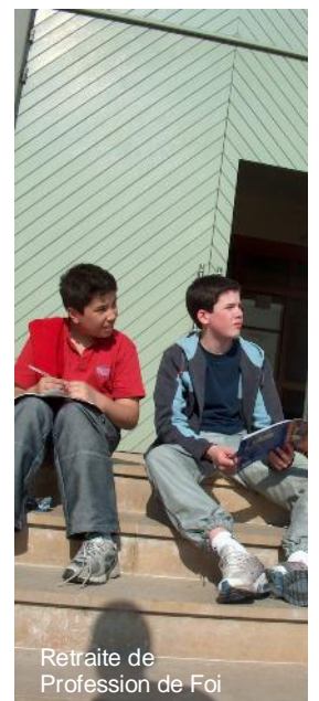
Retraite de Profession de Foi