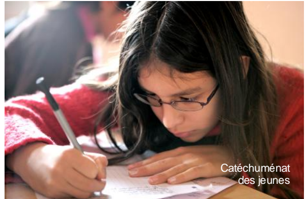
Catéchuménat des jeunes

« L'aumônerie existe depuis longtemps à Cergy comme un service de la paroisse. Créer une association d'aumônerie n'apportera pas de modification substantielle. Les activités seront semblables et elles continueront à se dérouler dans les locaux de la paroisse. Il ne s'agit pas de faire l'aumônerie dans les établissements scolaires mais de permettre aux jeunes de rejoindre l'aumônerie . Nombreux sont ceux qui ignorent jusqu'à l'existence de cette proposition. Créer une aumônerie permet simplement d'informer les familles et les jeunes. » ( Aumônerie infos n°3 du 1/09/2005).